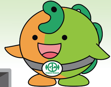
糸魚川市キャラクター「シオまる」